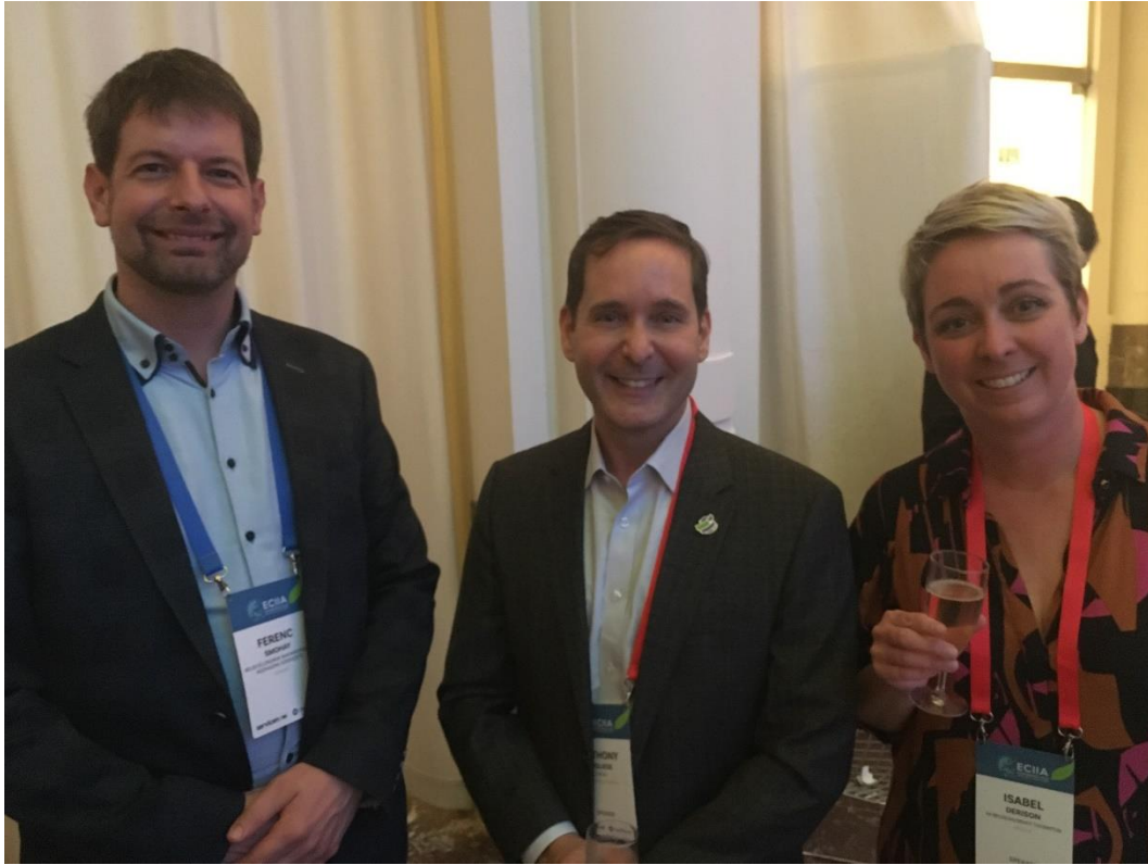
Helyszín: a Bozar